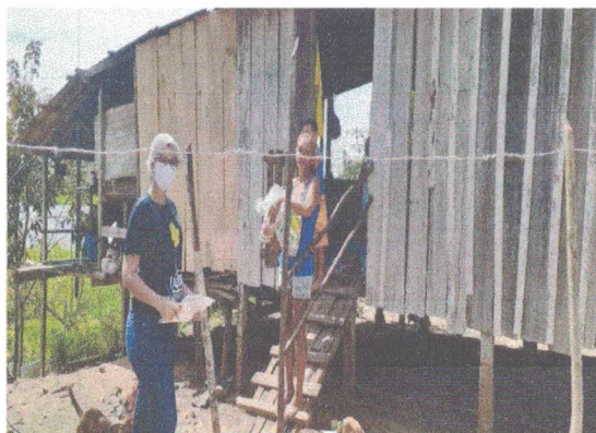
Comunidade Nova Jerusalém-Seringa