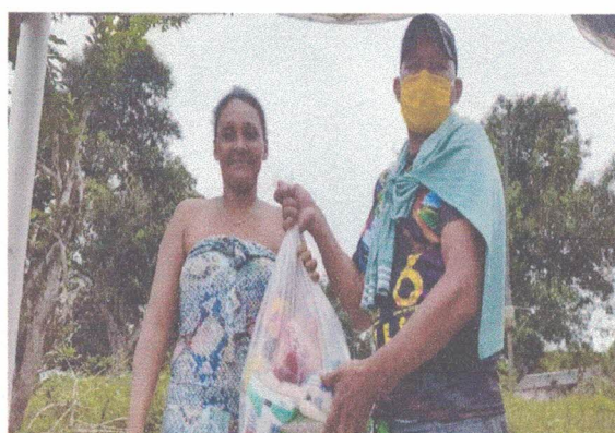
Comunidade São Pedro do Capivara