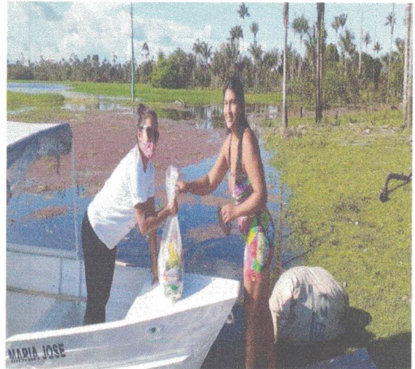
Comunidade São Lazaro do Taperebatuba.