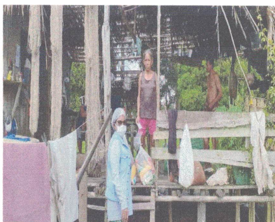
Comunidade São Sebastião do Forte