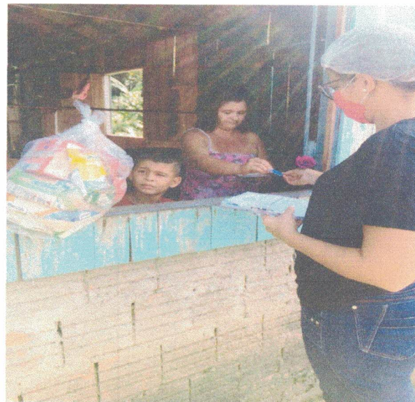
Estrada da Várzea