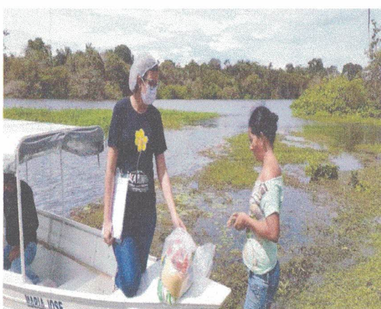
Comunidade Igarapé Açú