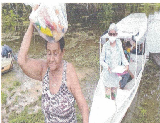
Comunidade São João